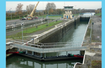
IV : Ecluse de Courchelettes