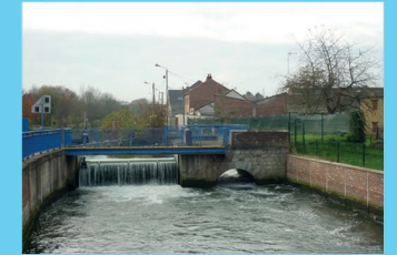
II : Ecluse de Lambres lez Douai