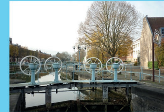
I : Ecluse des Augustins à Douai

L'écluse comprend un sas dans lequel on peut faire varier le niveau de l'eau. Il est isolé des biefs amont et aval par des portes (autrefois portes en bois de chêne munies de vannes dites ventelles).