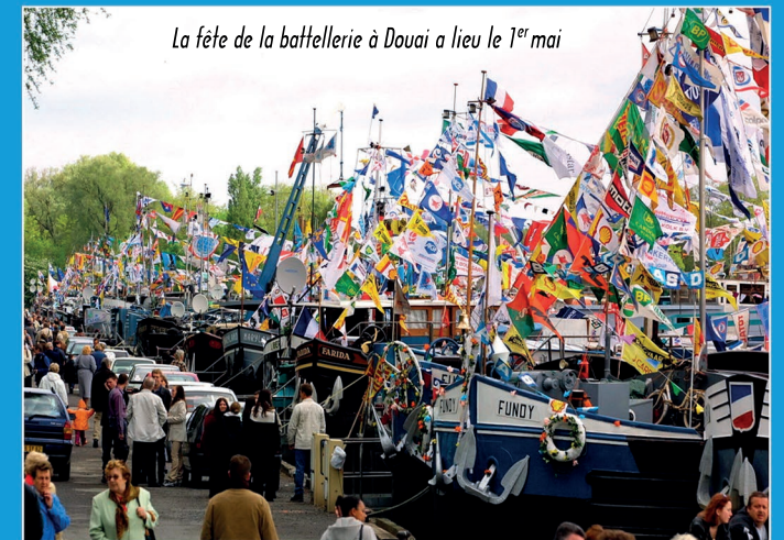
La fête de la battellerie à Douai a lieu le 1 er mai