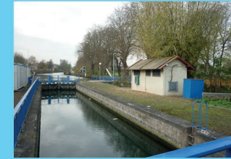
III : Ecluse des Couteaux à Courchelettes