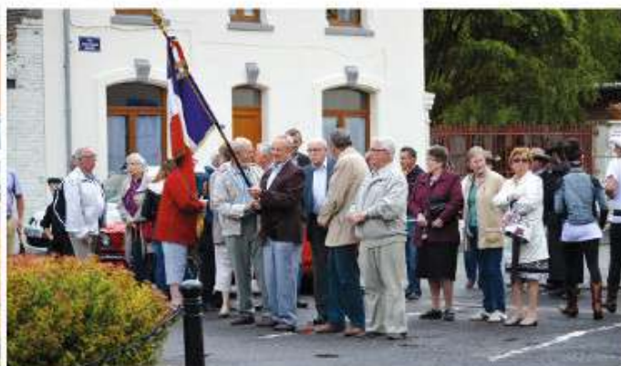
Cérémonie du 14 juillet .