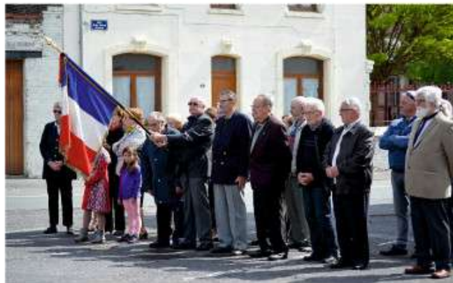
Commémoration de la victoire du 8 mai 1945.