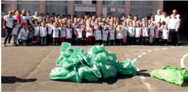
Protégeons la nature

« Voilà encore une année riche en projets qui se termine à l'école Jean de la Fontaine d'Aubigny au Bac. C'est le cœur gros que les CM2 ont dit au revoir à leur école pour un départ au collège. Accompagnés de leur enseignante, ils ont fait un dernier merveilleux voyage dans les îles et sont prêts pour des vacances bien méritées. On leur souhaite les mêmes réussites pour leur scolarité au collège. »