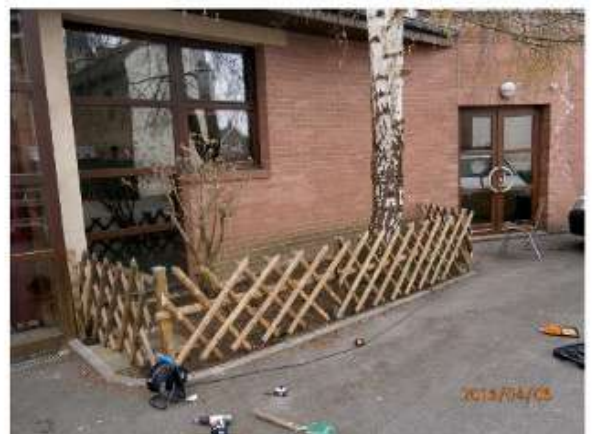
avant scène de la salle des fêtes