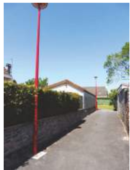
Aménagement du chemin piétonnier rue M Mollet/ JB Alphonse.