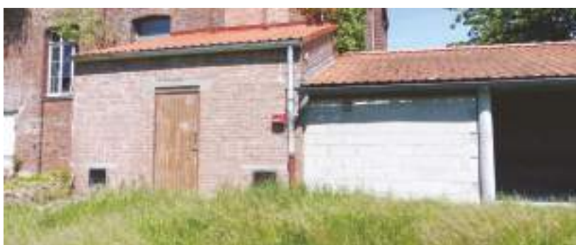
La toiture de la chaufferie a été refaite.