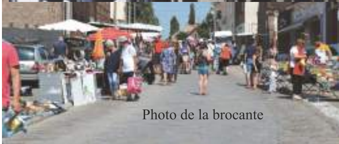
Photo de la brocante