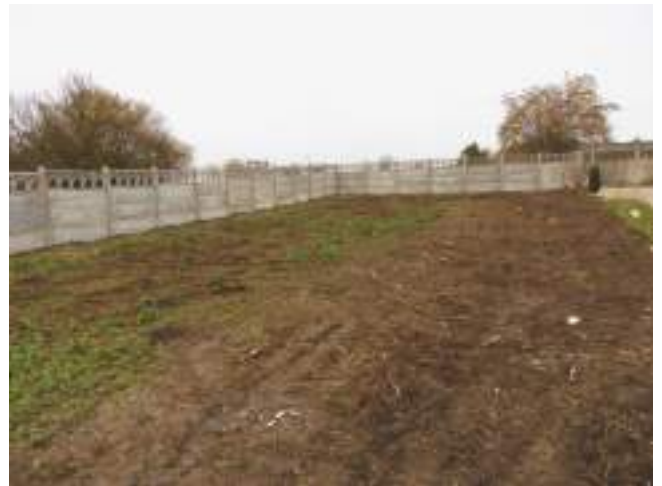
L'agrandissement du cimetière était devenu indispensable, les clôtures sont terminées.