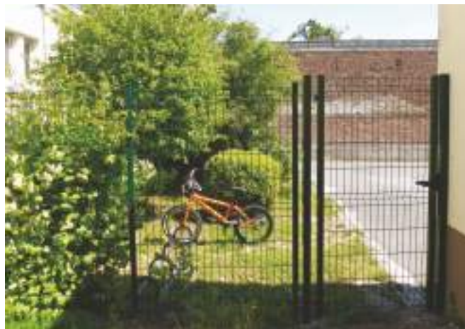
Un nouveau portillon relie la salle de la garderie à la cour de l'école.