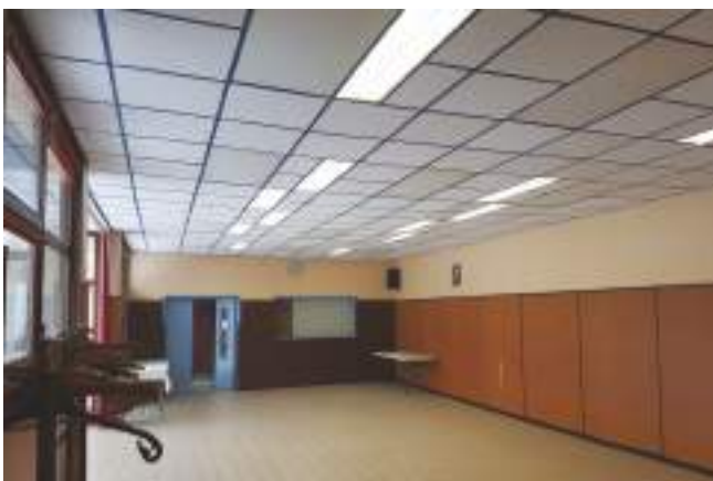
Le plafond de la salle des associations a été rénové.