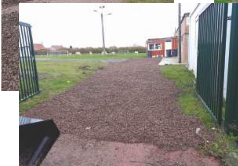
Remise en état des voies d'accès au terrain de foot par le personnel communal.