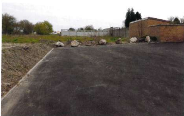
Le nouveau parking du cimetière

La rénovation de la rue de la plage est terminée. Les riverains nous ont fait part de leur satisfaction. L'accès au cimetière est beaucoup plus accessible depuis la création du nouveau parking. Le restaurant et la base de loisirs sont aussi desservis par cette route flambant neuve. Nous en profitons pour remercier Douaisis Agglo qui a financé la moitié de ces travaux.